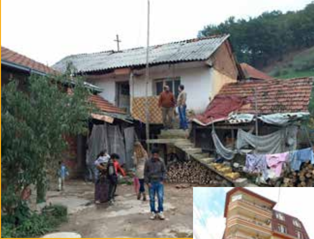
Zurück in der alten Heimat: Das Team der Beratungsstelle in Priština unterstützt die Ankommenden (rechts). Oben: Besuch bei einer 11-köpfigen Roma-familie.

bereiten und an geeignete Ansprechpartner dort zu vermitteln. Mitunter gibt es schon Kontakte vor der Rückkehr. In manchen Fällen ist auch eine Qualifizierung ratsam. Sind Kinder dabei, achten die Beraterinnen darauf, dass der Wechsel für sie möglichst sanft verläuft, dass sie zum Beispiel nicht mitten im Schuljahr abreisen müssen. Für sie ist die Rückkehr oft besonders hart, vor allem, wenn sie schon seit mehreren Jahren in Deutschland sind.