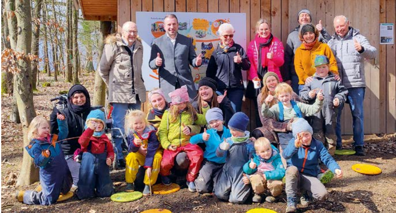
Viele Freue und Lob bei der Übergabefeier der Waldfuchse in Schonungen.