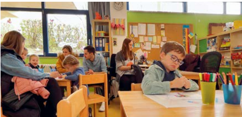
Mandalamalern in der Gruppe Narnia, der Hortwelt der ersten und zweiten Klasse

Nachdem die überwiegende Zahl der Hortgruppen an der Eichendorffschule in verschiedenen, umgestalteten Klassenräumen untergebracht ist, soll das jahrzehntelange Provisorium bald ein Ende haben. Im 50. Jubiläumsjahr ist geplant, dass die Gemeinde bis 2025 ein eigenes Haus der Schulkindbetreuung für 280 Kinder in elf Hortgruppen sowie drei Räume für die Mittagsbetreuung von 60 Kindern errichtet, für rund 12,8 Millionen Euro.