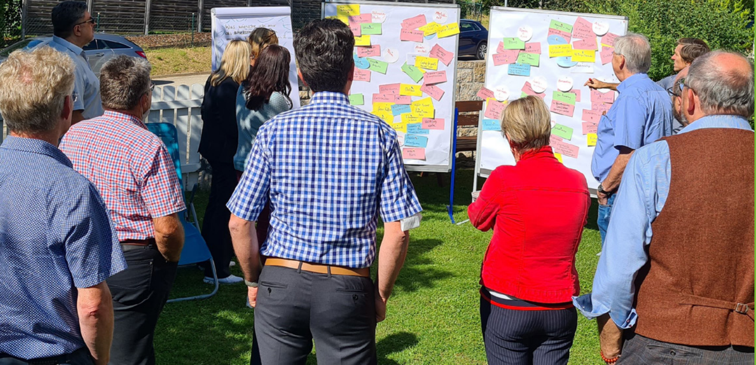
Gemeinsam auf Kurs nach der Klausurtagung der Bezirks-Geko.