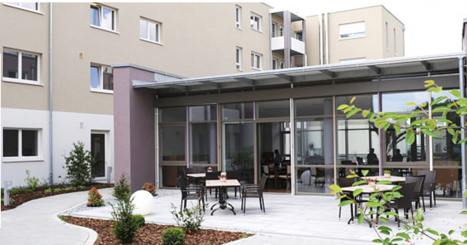
AWO Seniorenbetreuung in Cadolzburg.

➔ Weitere Informationen: www.awo-neustadt.de