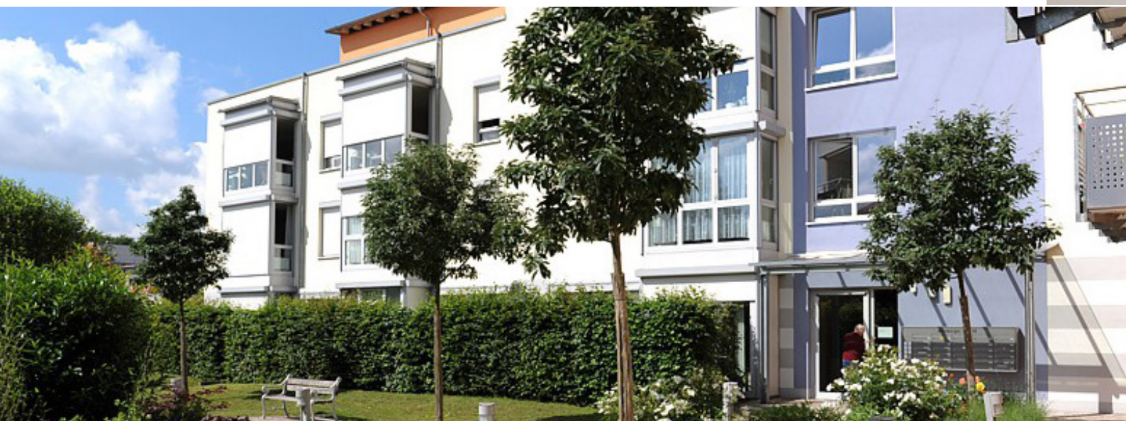
AWO Senioren-Residenz in Langenzenn.

Neben der Arbeit der Ortsvereine ist der Kreisverband Träger von mehreren Altenhilfeeinrichtungen und einer Suchttherapieeinrichtung. Insgesamt bieten die Einrichtungen aktuell 430 Menschen einen sicheren und sozialen Arbeitsplatz. Mit Weihnachtsfeiern, Betriebsausflügen und Gesundheitstagen gibt es nicht ganz alltägliche Sonderleistungen für die aktiven Mitarbeiter*innen und verdienten Rentner*innen. Durch zusätzliche Gesundheitsleistungen, Bonuszahlungen, Einsparprämien