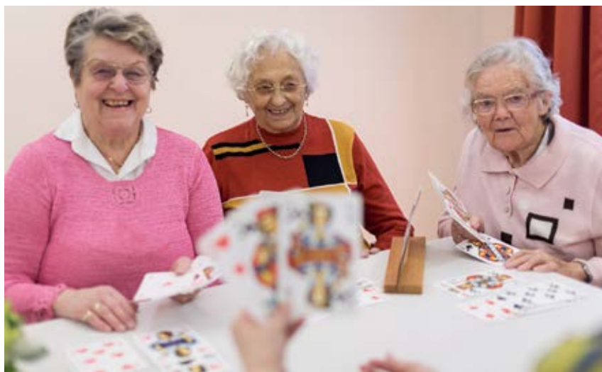
Schlechte Karten haben Spielende mit solch verschwommenem Blick. Besseres Licht, Brille oder Lupe helfen oder Karten mit größerer Schrift.

Internet: www.blindeninstitut.de/gutes-sehen