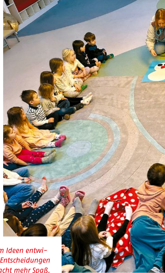
AWO Ober- und Mittelfranken

Buchstäblich im Sandkasten werden also die Kompromisse von morgen erzielt. In AWO-Kitas gelangen Kinder zu der nicht immer einfachen, aber essenziellen Erkenntnis, dass ihre Freiheit dort endet, wo die der anderen beginnt. „Demokratie ist manchmal anstrengend. Aber: Die Investition in