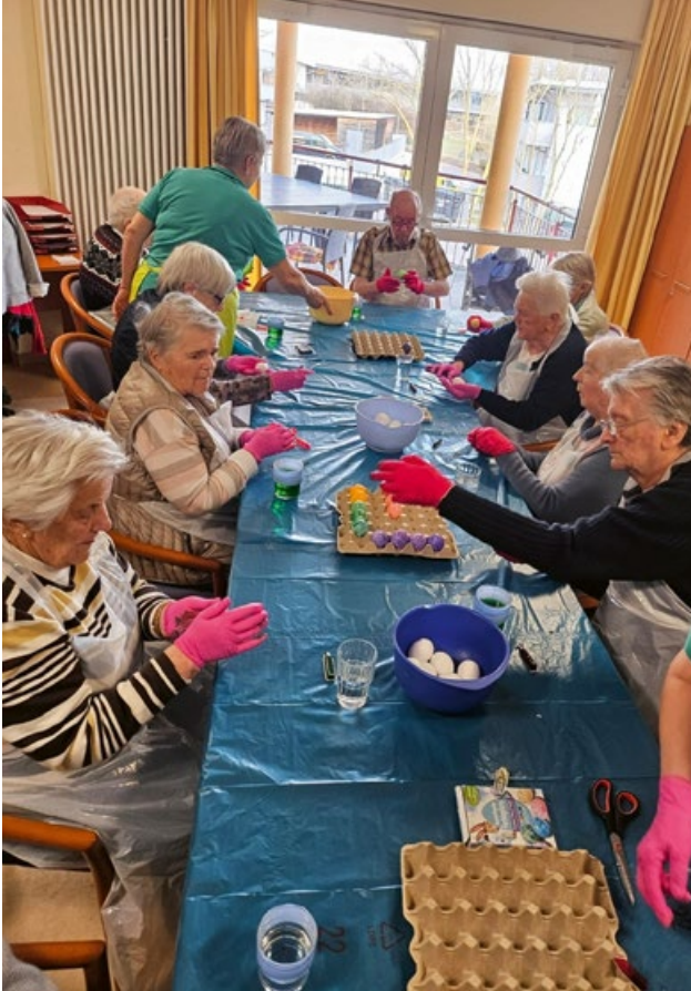
Die Bewohner*innen des Seniorenheims Bayer- waldblick in Landau beim Färben.