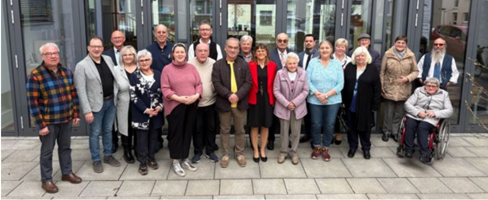
Ein Teil der Geehrten sowie der Vorstandschaft des AWO-Ortsvereins und Kreisverbands