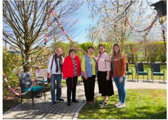
Besuch aus Frontenhausen, der Kindergarten Zauba- woid war mit 1200 ausgepusteten und gestalteten Os- tereiern die fleißigste Einrichtung