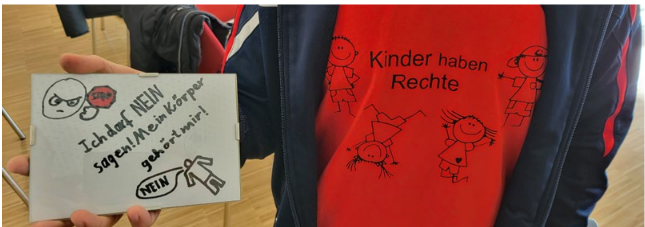
Die Kinder setzten sich im dritten Workshop intensiv mit ihren Kinderrechten auseinander.

Verwendungszweck: „Kinderarmut abschaffen“ Spendenkonto der AWO Schwaben IBAN: DE93 7205 0000 0252 7856 54 PayPal: herz@awo-schwaben.de