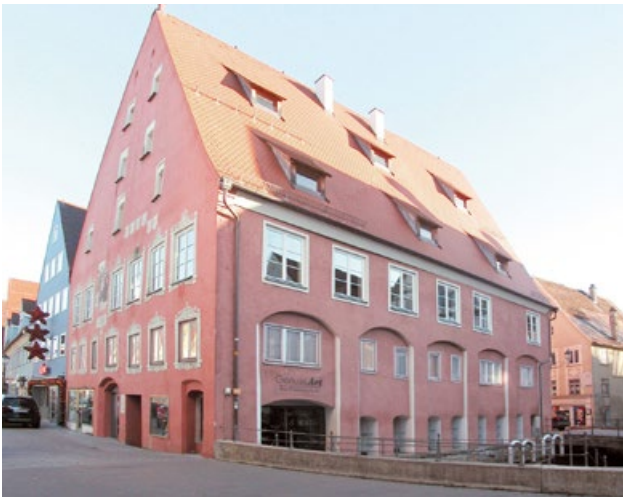
Das Kramerzunftstube in Memmingen. Hier wurden die bedeutenden „Zwölf Artikel“ konzipiert.