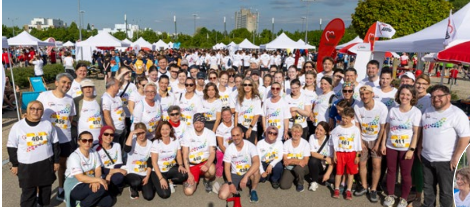
Das Team der AWO Augsburg beim 14. M-net Firmenlauf

Zwei Mitarbeiterinnen der AWO Augsburg beim Zieleinlauf