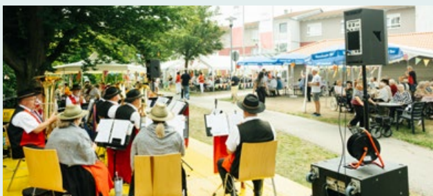
Das Sommerfest im Christian-Dierig-Haus bei strahlendem Sonnenschein: Die Bewohnerinnen und Bewohner der Pflegeeinrichtung feiern mit ihren Angehörigen, den Mitarbeitenden und vielen weiteren Gästen.

Brandereignisses vom letzten Jahr beseitigt wurden, konnten punktgenau zum Fest abgeschlossen werden. Durch das beherzte und professionelle Handeln der Mitarbeitenden des Hauses in der Brandnacht vom 27.11.2024 und der Feuerwehren waren alle Menschen rechtzeitig in Sicherheit gebracht worden und es wurde niemand verletzt. Allerdings waren die Sachschäden durch den Brand erheblich. Das große Müllcontainer-Haus vor der Pflegeeinrichtung wurde durch den Brand völlig zerstört, die Fenster in der Hauptfassade mussten teilweise erneuert werden. Ebenso war ein großer Teil der Fassade mit der Haupteingangstür zerstört worden. Nun sind alle Schäden beseitigt und es gibt keine Einschränkungen mehr – was für ein Festtag!