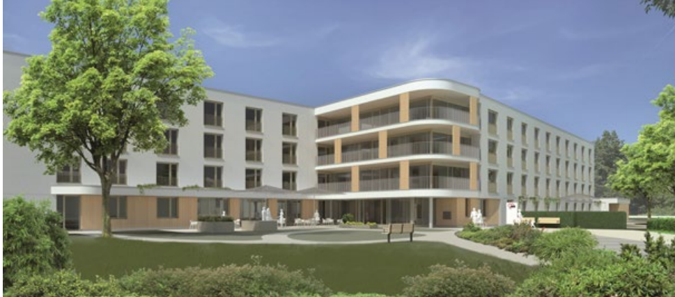
Grafik: Höss Amberg + Partner Architekten

Nachhaltigkeit und hohe Lebensqualität Hand in Hand. Das neue AWO Seniorenheim soll ein Ort zum Wohlfühlen werden.