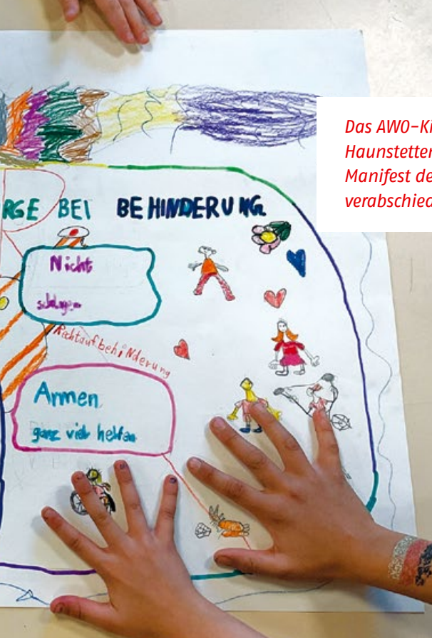
Das AWO-Kinderhaus Haunstetten hat ein Manifest der Kinderrechte verabschiedet.

berechtigung auseinander. Nach Abschluss der Ausbildung, für die es ein Zertifikat gibt, leiten die Absolventen, unterstützt durch eine sozialpädagogische Fachkraft, in Schulen und Jugendeinrichtungen Workshops für andere Jugendliche jeden Geschlechts nach der Methode peer-to-peer, um Gespräch auf Augenhöhe zu ermöglichen.