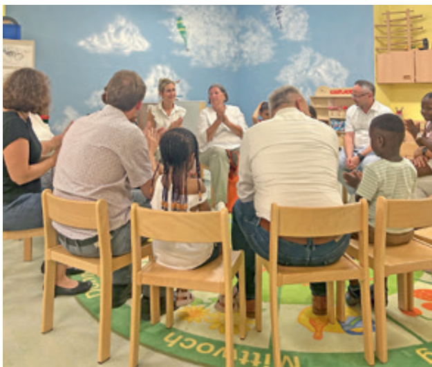
Besuch in der KITA in Kitzingen

Auf dem Programm stand unter anderem der Besuch im Marie-Juchacz-Haus der AWO im Würzburger Stadtteil Zellerau. „Das moderne Haus ist ein Leuchtturmprojekt in der Altenpflege“, urteilte Sonnenholzner hinterher. Äußerst angetan zeigte sie sich auch vom Mittagessen in der jüngst eröffneten Tagespflege in Kitzingen.