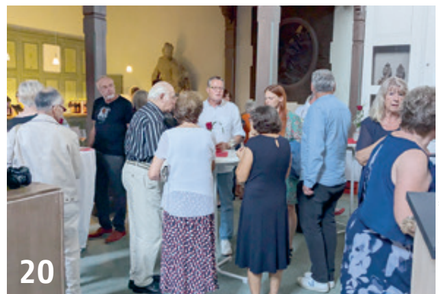
Schonungen: Feier zum Hundertsten

Mit der AWO unterwegs • 60 Jahre AWO Estenfeld • Sommertour der Bundesvorsitzenden • Reisen mit Herz • 100 Jahre AWO Schonungen