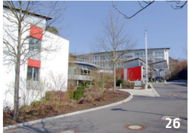
Uniklinik Würzburg kauft Geriatrie

Wusstest Du schon, dass ... • Kreiskonferenz Hassberge