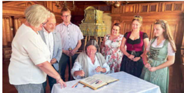
Eintrag ins Goldene Buch der Stadt Kitzingen