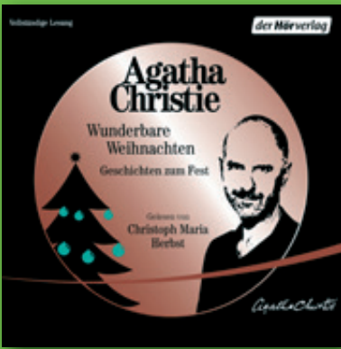
Wunderbare Weihnachten Geschichten zum Fest

Agatha Christie, erschienen 2023 in der Hörverlag ISBN 978-3-8445-5095-5, € [D] 11,95